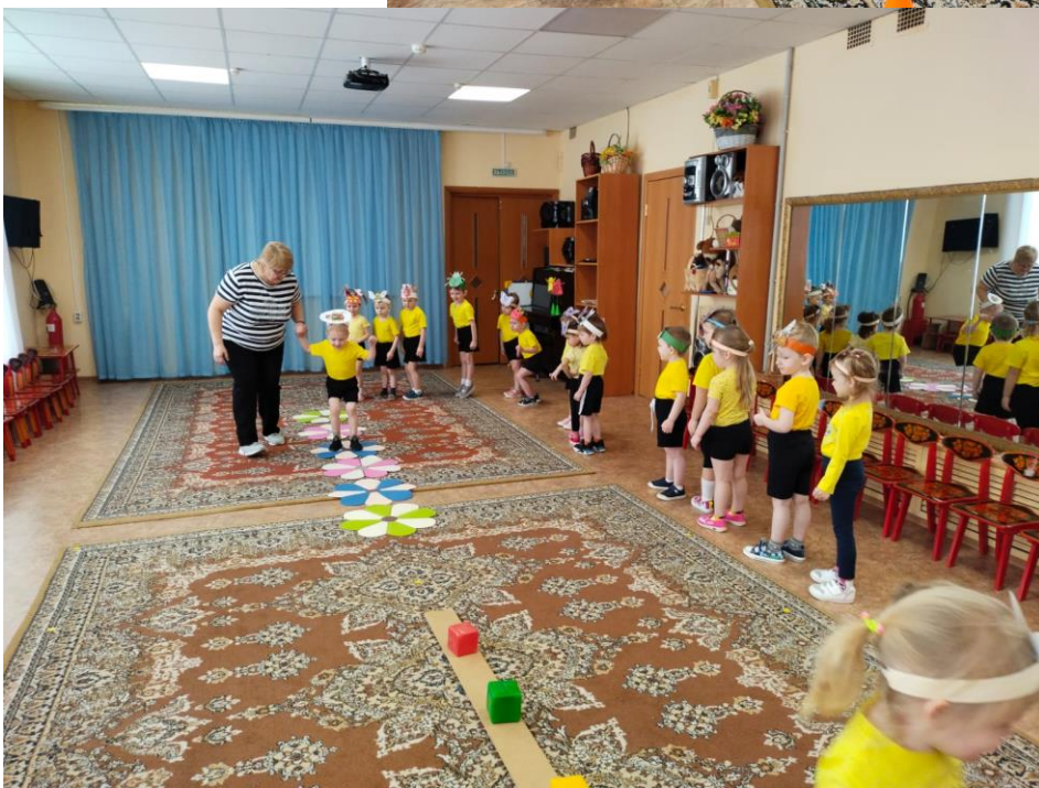
Встретили кузнечика, он научил бабочек и жучков прыгать с цветочка на цветочек!