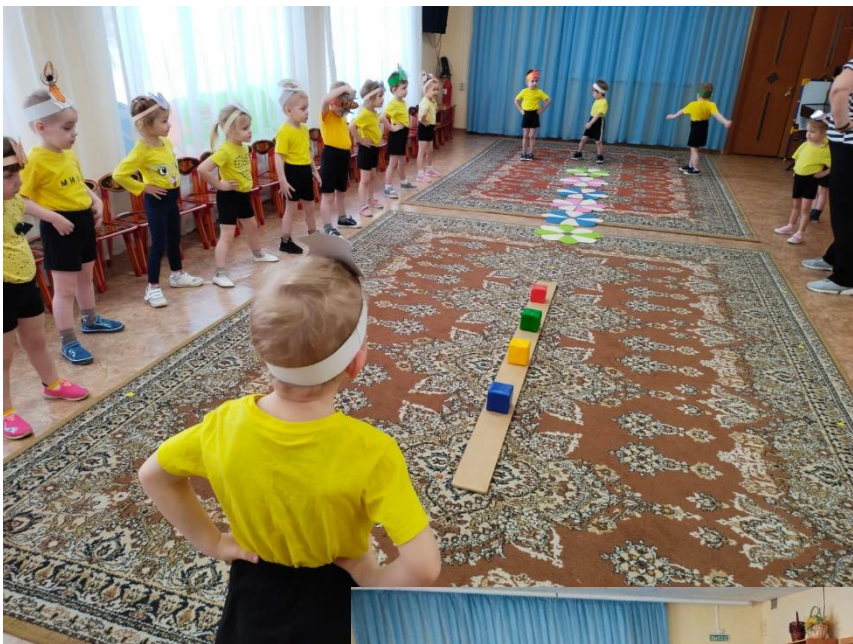
На цветочной полянке играли – упражнения выполняли!