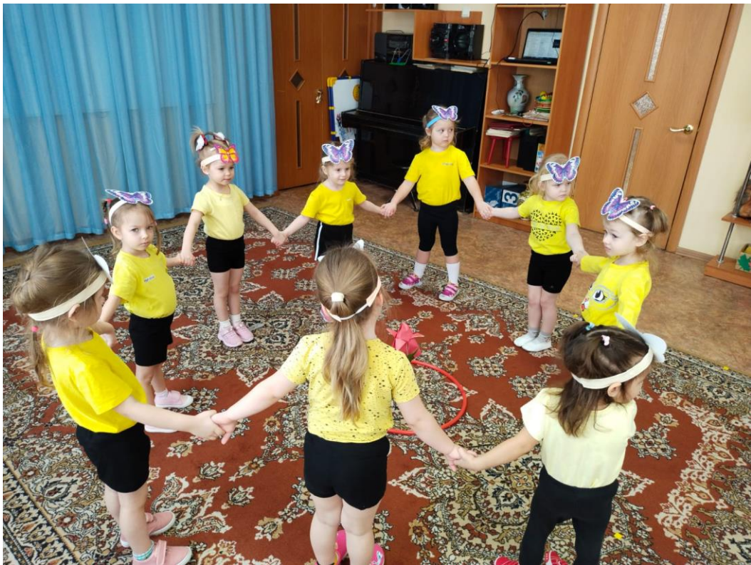
И бабочки тоже нашли свой красный цветочек!