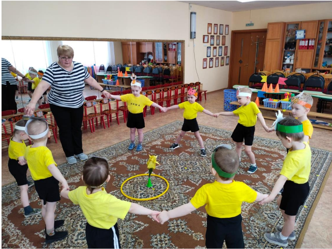
Вот жучки нашли свой жёлтый тюльпан!