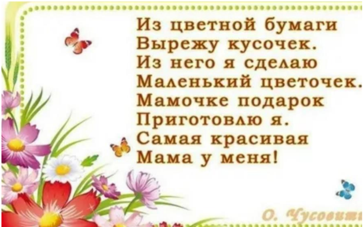
Дети сделали своими руками подарки маме на день 8 марта.