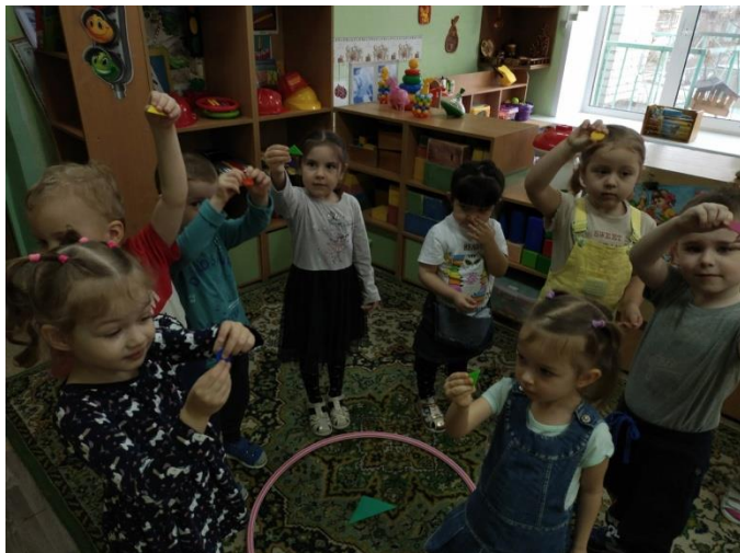
Дидактическая игра «Найди свой домик».