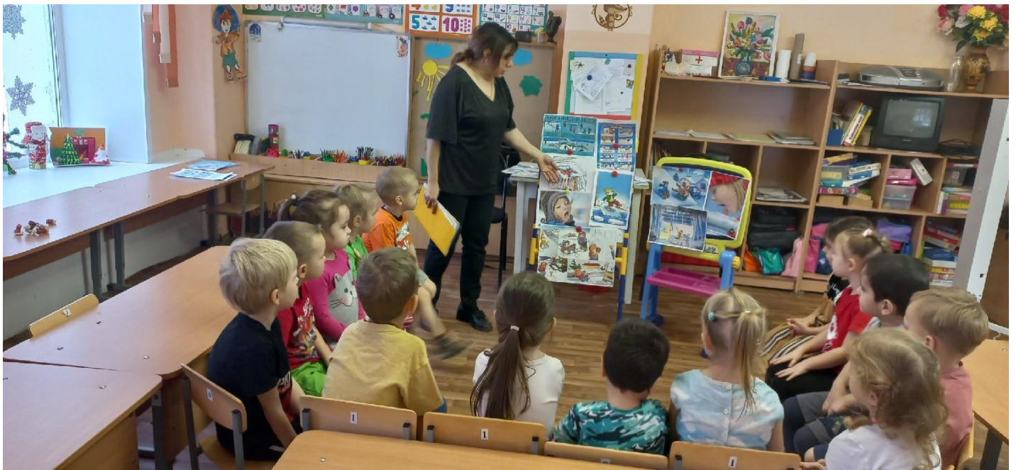
Так же провели беседу с родителями об опасности зимы: